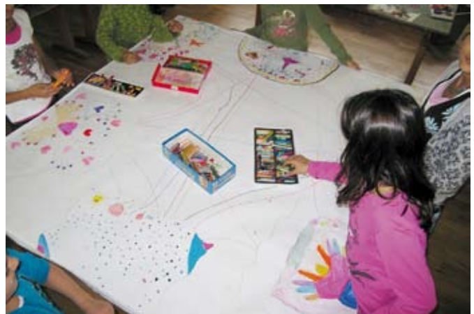
Das eigene und das gemeinsame Feld. Eine Art therapeutischer Vertrag