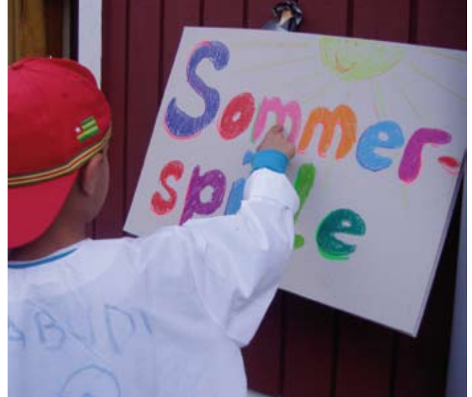
Lesen Sie auch das Gespräch mit den Projektleitern auf den kommenden Seiten.

Jedes Kind gestaltete im Laufe der Projektwochen einen Umzugskarton nach den eigenen Wünschen, welcher am Ende mit vielen selbstgemalten Bildern und Erinnerungen an die Sommerspiele von den Kindern mit nach Hause genommen wurde. Neben der künstlerischen Arbeit wurden Bewegungs- und Rhythmikspiele gemacht und viel gemeinsam gesungen. Beim großen Abschlussfest trugen die Kinder ihren Karton in einem Umzug stolz durch die Unterkunft verabschiedeten sich nach vielen erlebnis- und arbeitsreichen Tagen mit Gesang vom Children for Tomorrow-Team.