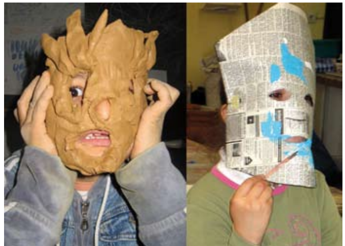
Wie sich zeigen? Eine Maske aus Ton.